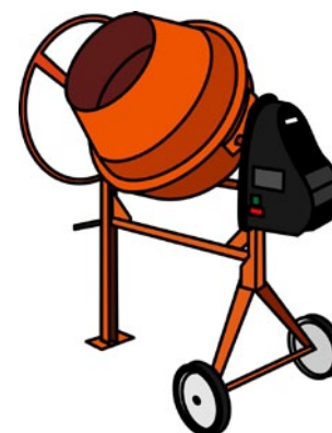
Rys. 5. Osłona elementów napędowych