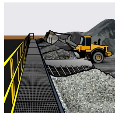
Rys. 4. Zabezpieczenie zbiorników zasypowych