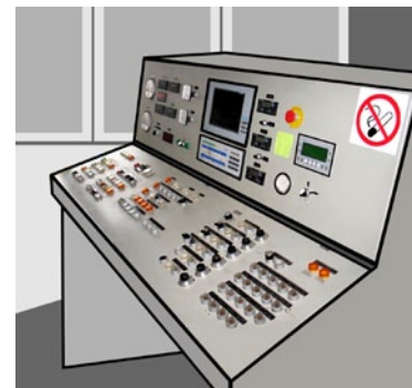
Rys. 3. System sterowania procesem produkcji