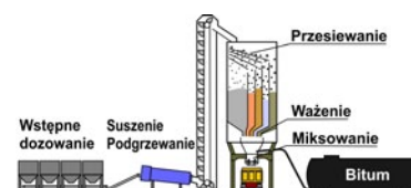
Rys. 2. Wytwarzanie mas bitumicznych