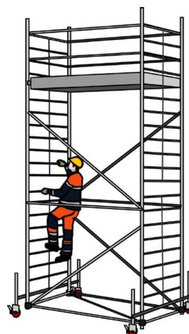
Rys. 1. Prace na rusztowaniach jezdnych