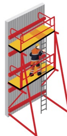
Rys. 2. Prace na pomostach roboczych