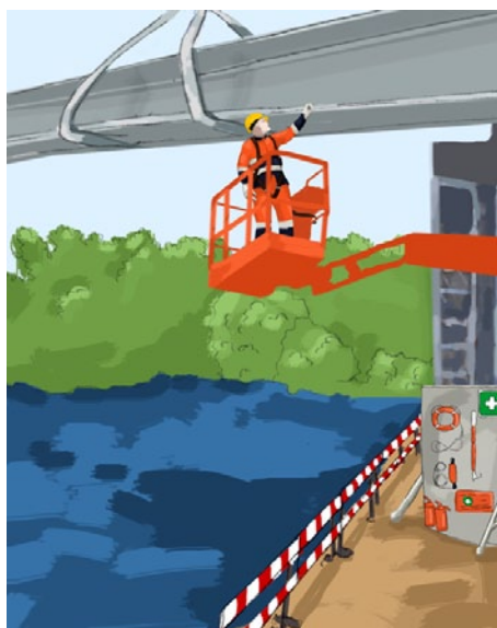
Rys. 4. Prace z podnośnika wykonywane nad wodą