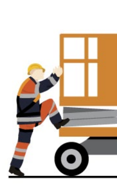
Rys. 5. Bezpieczne wchodzenie do kosza