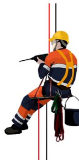
Rys. 2. Prace z dostępu linowego