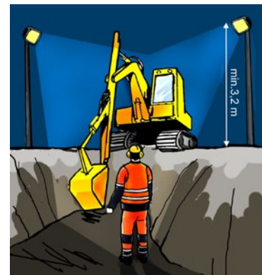
Rys. 5. Oświetlenie placu budowy