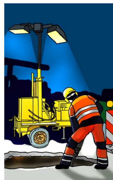
Rys. 6. Oświetlenie na statywach